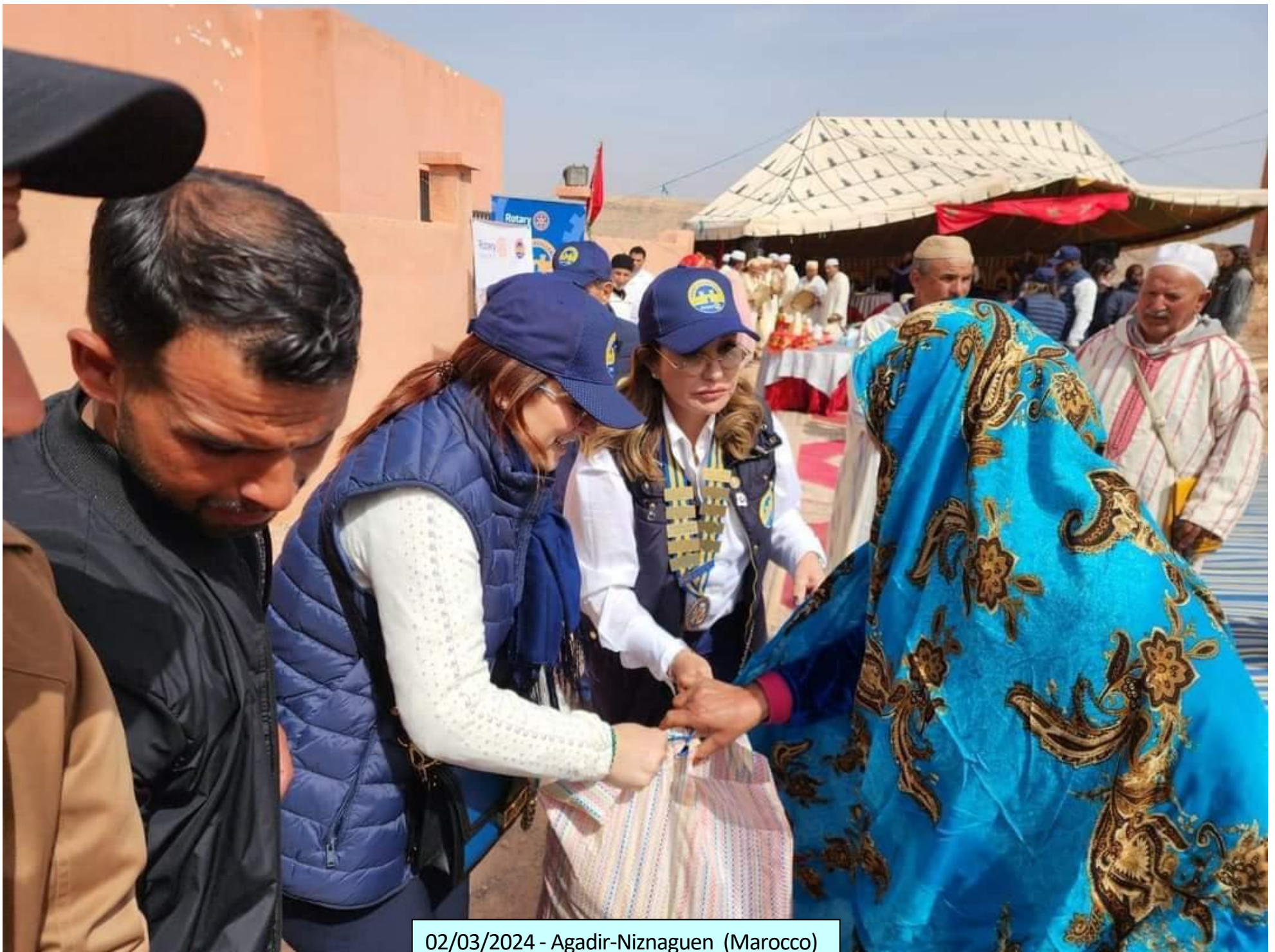
02/03/2024 - Agadir-Niznaguen (Marocco)