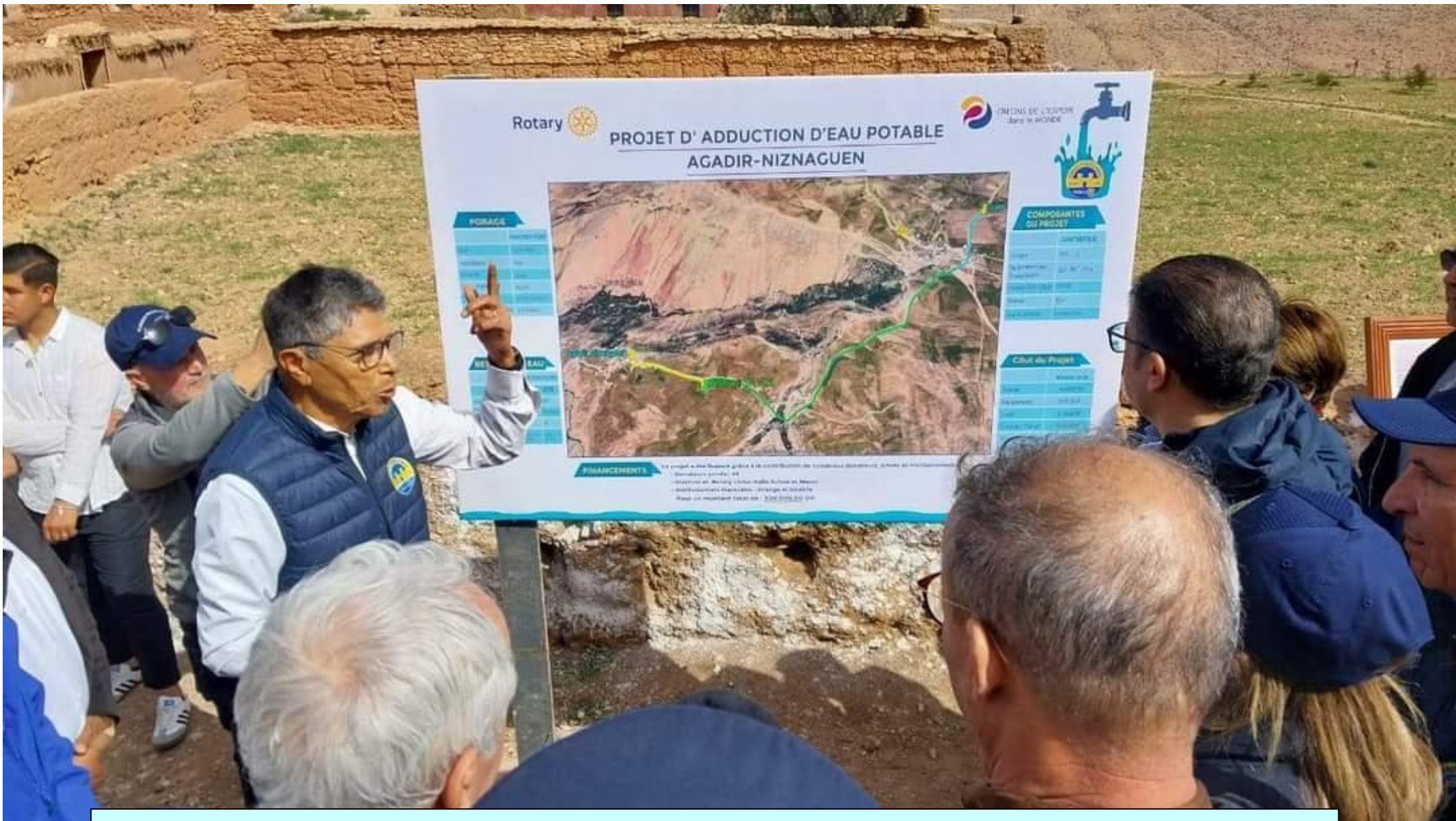
02/03/2024 - Agadir-Niznaguen (Marocco) - Cerimonia di inaugurazione dell'impianto di adduzione idrica e dei pozzi d'acqua