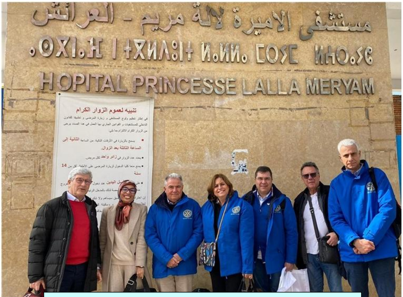
Febbraio 2023 - Larache (Marocco) - Squadra di Formazione Professionale VTT (Vocational Training Team) dei Distretti Rotary 2110 e 2080 in Marocco per il progetto di Sovvenzione Globale (Global Grant), realizzato in Marocco per la creazione presso l'Ospedale "Lalla Meriem" di Larache del "Centro per la Diagnosi e la Terapia della Talassemia"