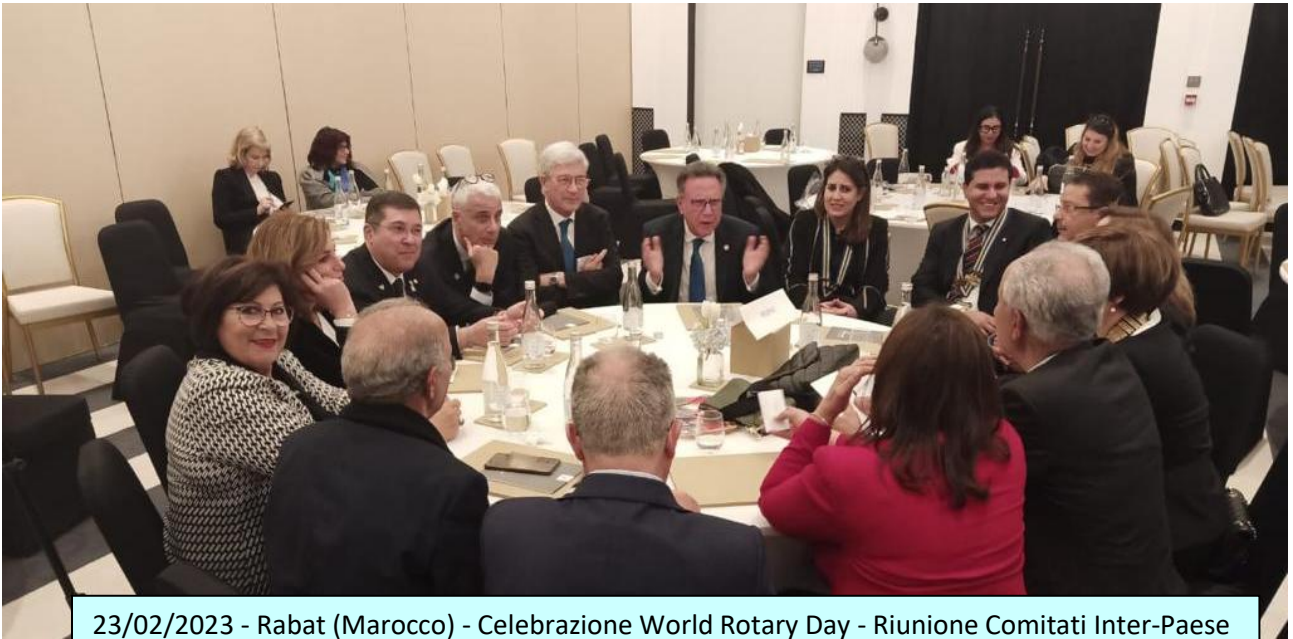
23/02/2023 - Rabat (Marocco) - Celebrazione World Rotary Day - Riunione Comitati Inter-Paese Italia, Malta, San Marino e Marocco