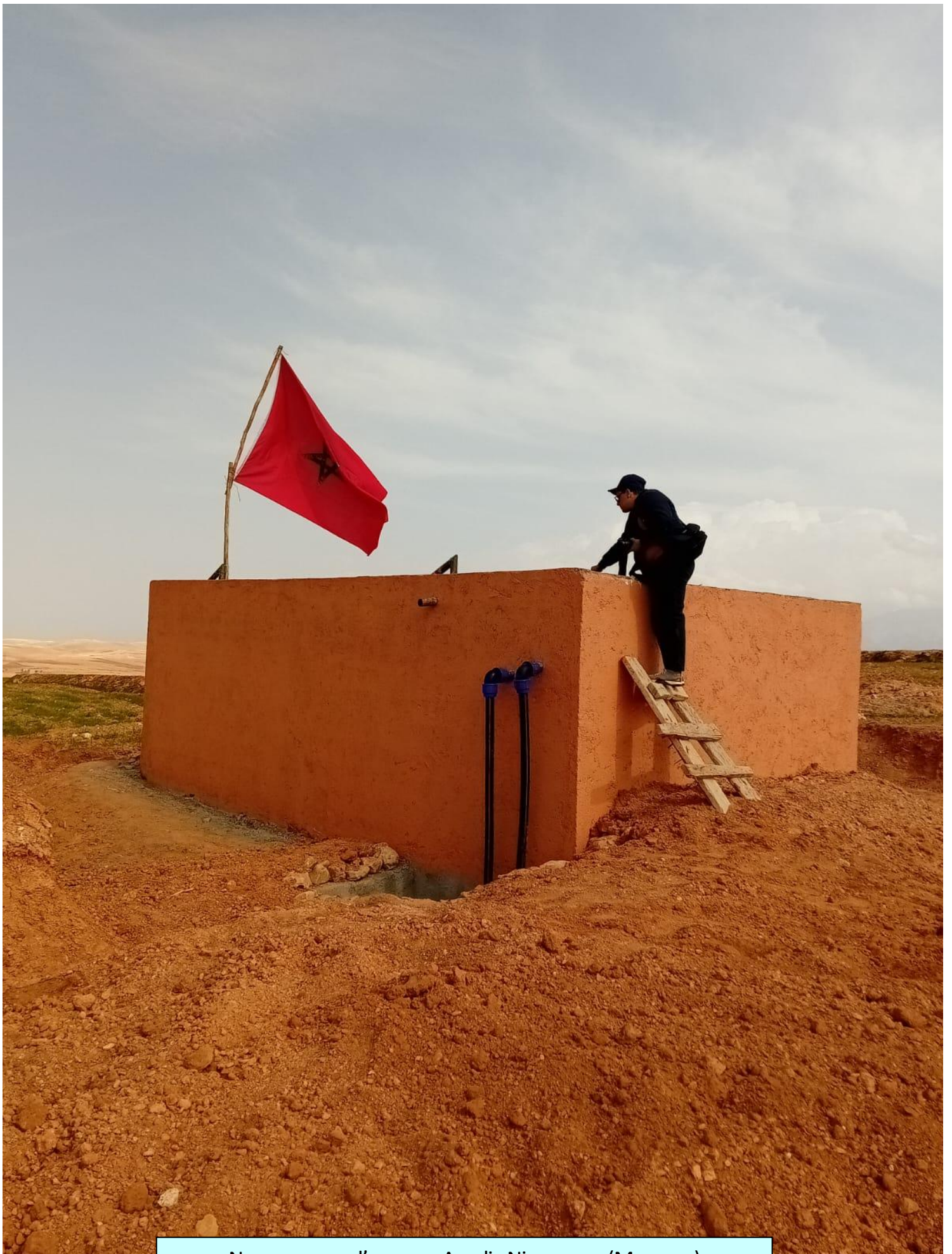
Nuovo pozzo d'acqua a Agadir-Niznaguen (Marocco)