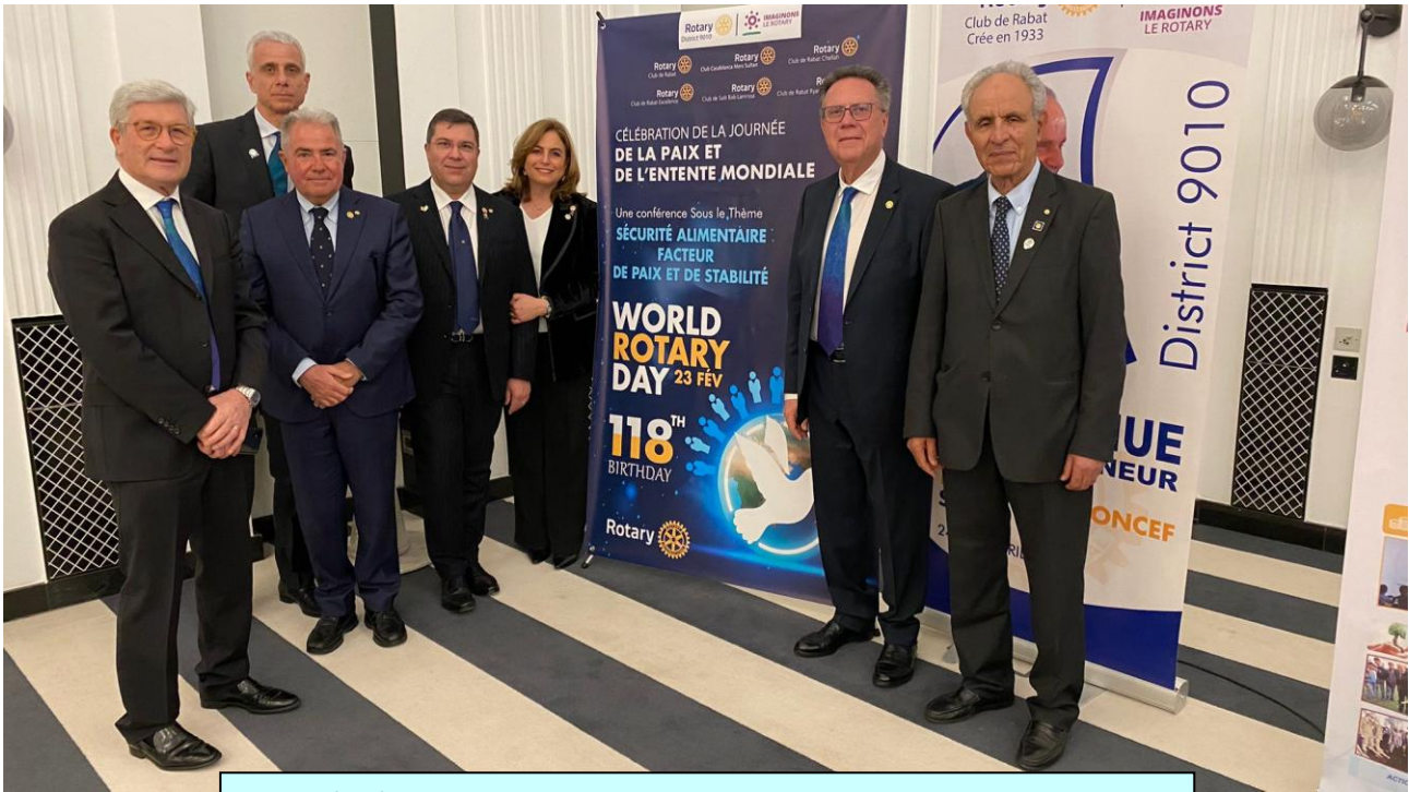
23/02/2023 - Rabat (Marocco) - Celebrazione World Rotary Day