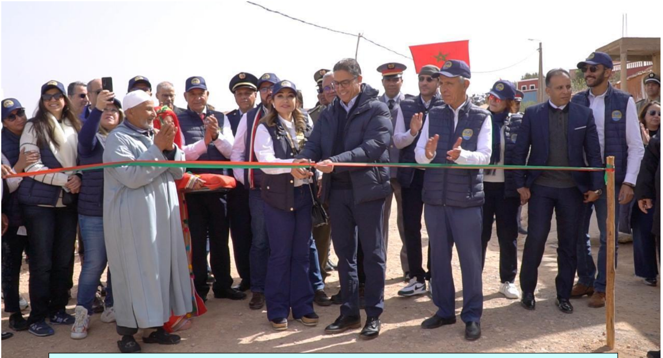
02/03/2024 - Agadir-Niznaguen (Marocco) - Cerimonia di inaugurazione dell'impianto di adduzione idrica e dei pozzi d'acqua