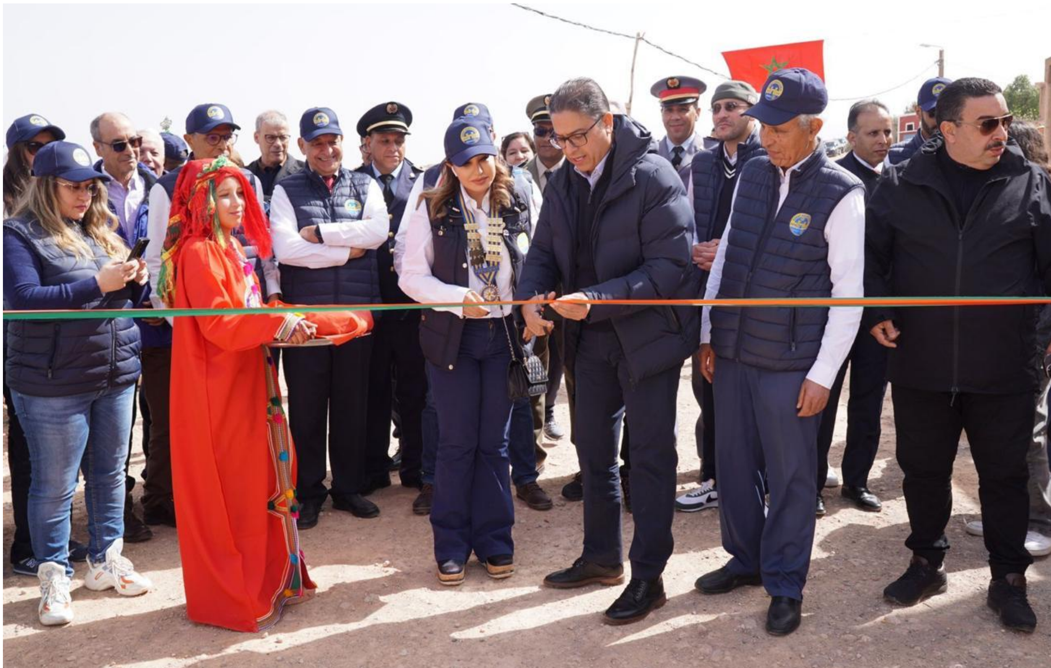
02/03/2024 - Agadir-Niznaguen (Marocco) - Cerimonia di inaugurazione dell'impianto di adduzione idrica e dei pozzi d'acqua - Rachid Benchikhi, Governatore della provincia di Al Haouz, taglia il nastro, con a fianco Najat Lecheheb e PDG Jil Antari