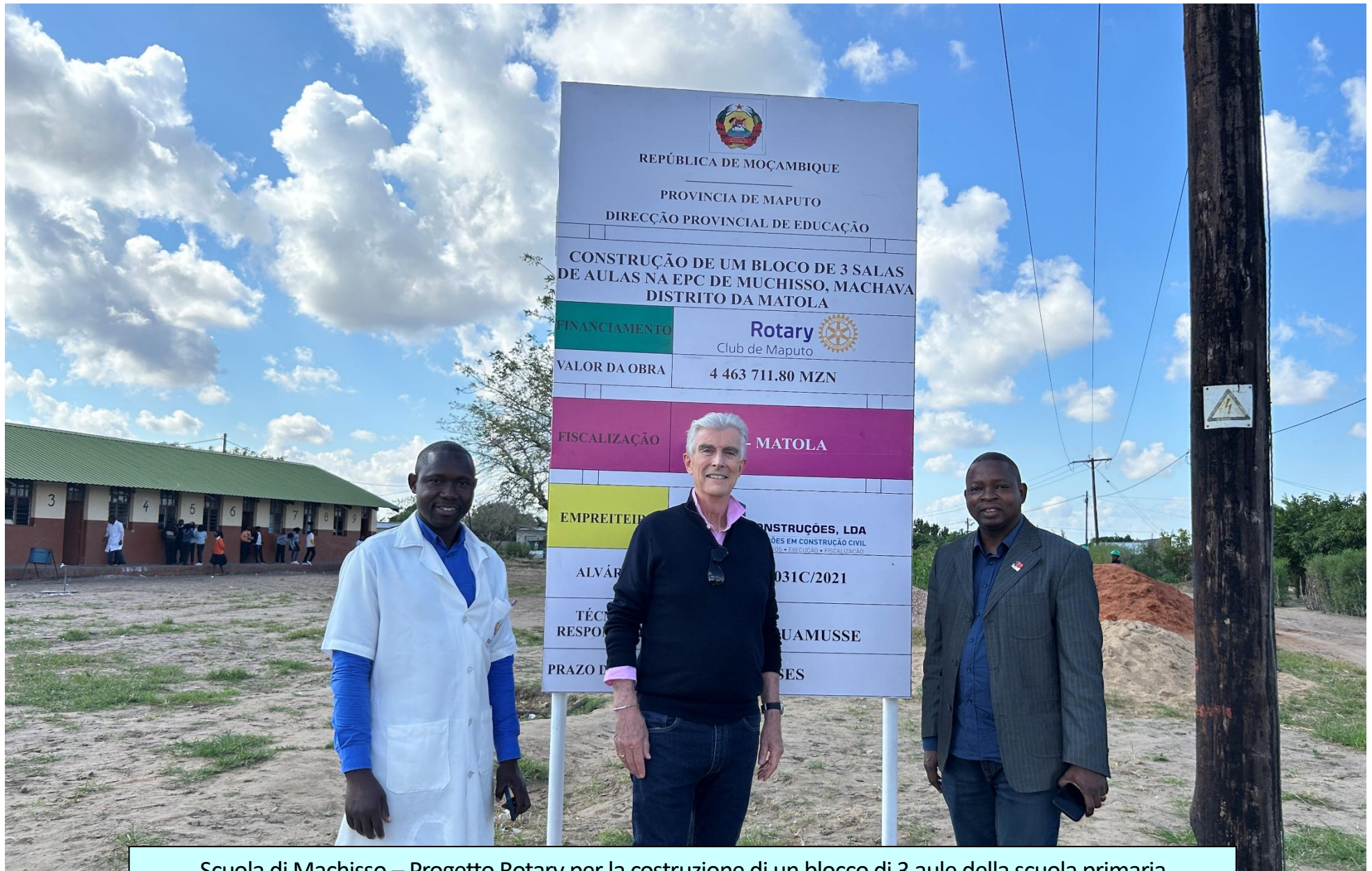
Scuola di Machisso – Progetto Rotary per la costruzione di un blocco di 3 aule della scuola primaria