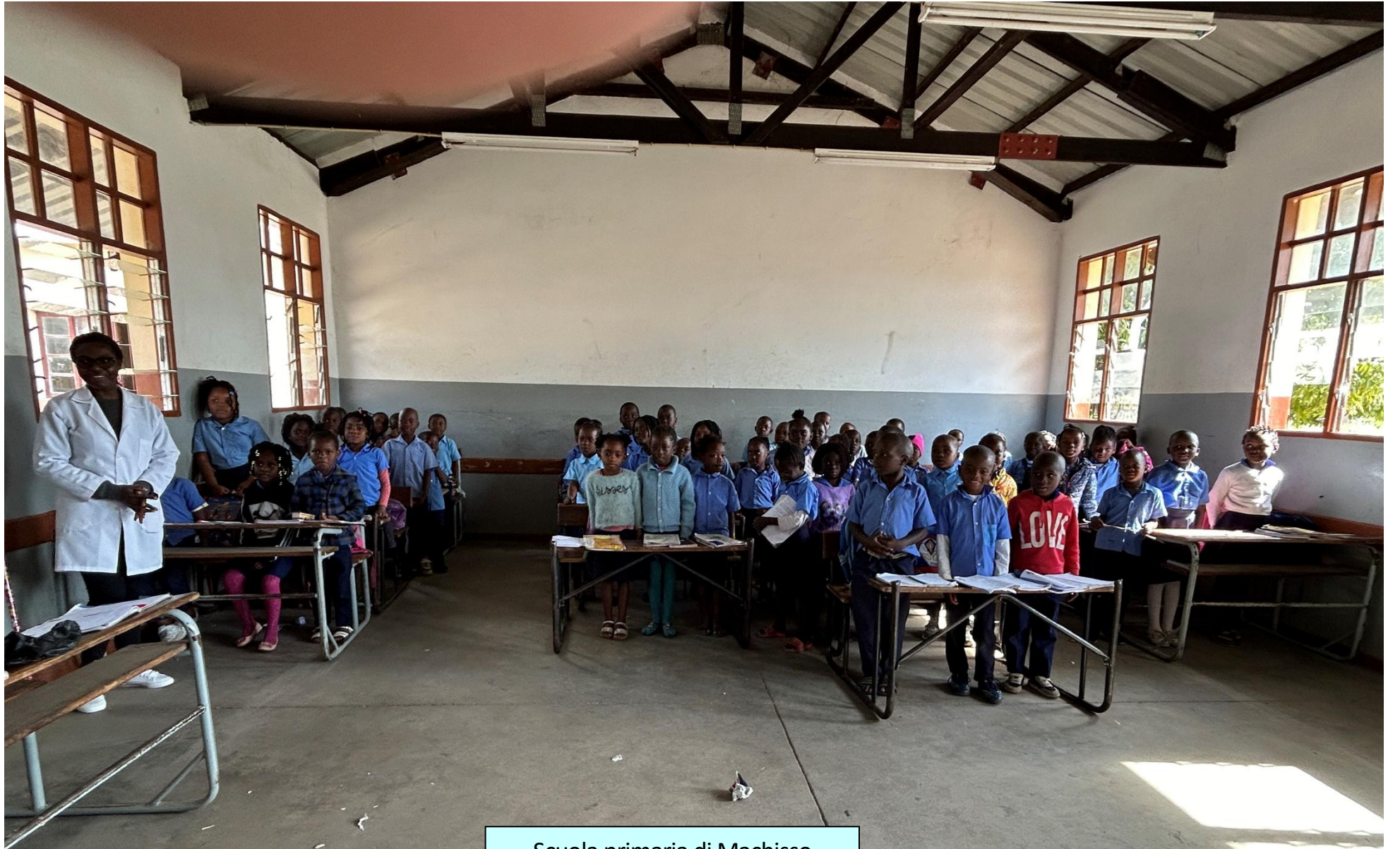
Scuola primaria di Machisso