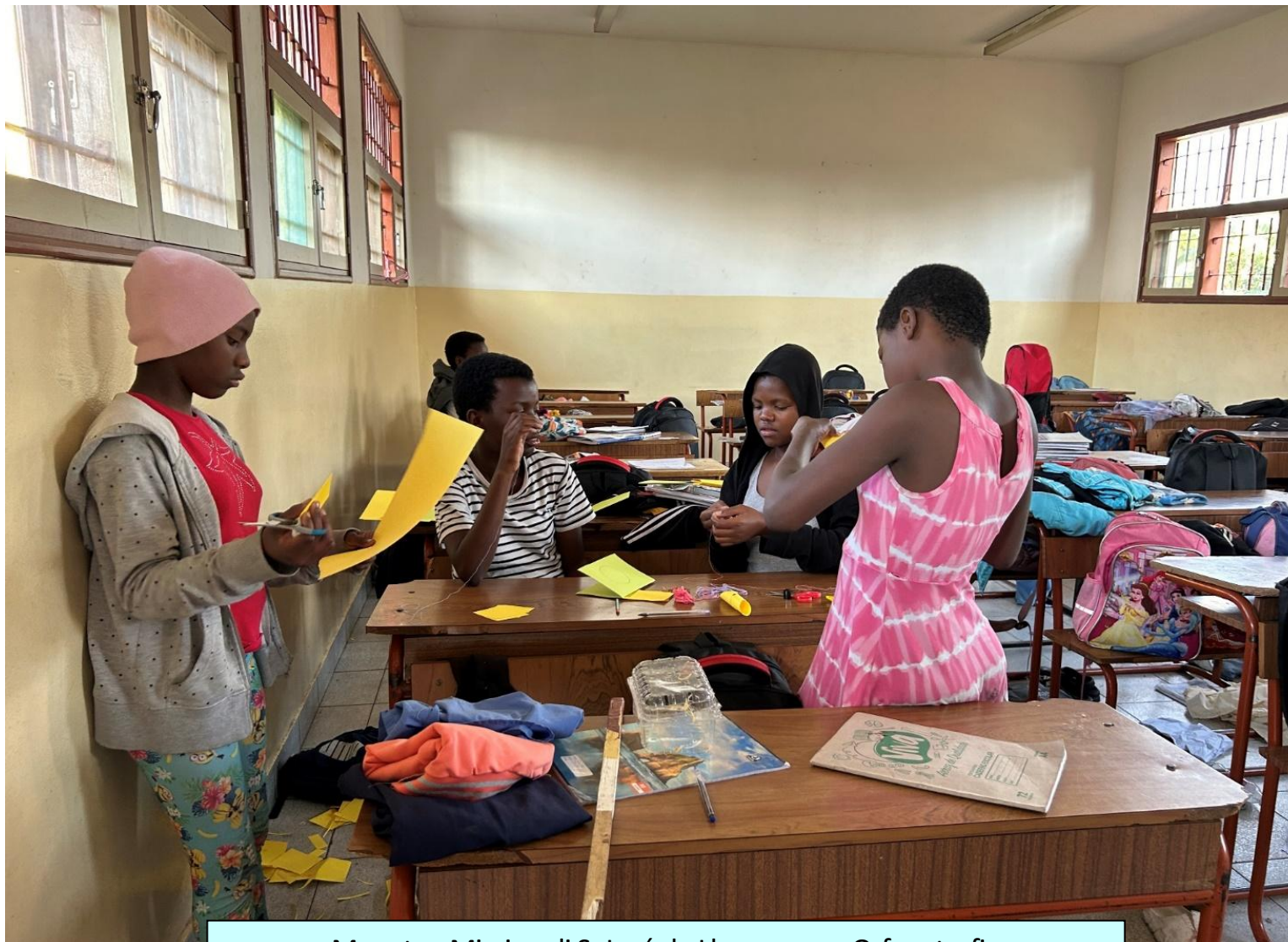
Maputo - Mission di S. José de Lhanguene - Orfanotrofio