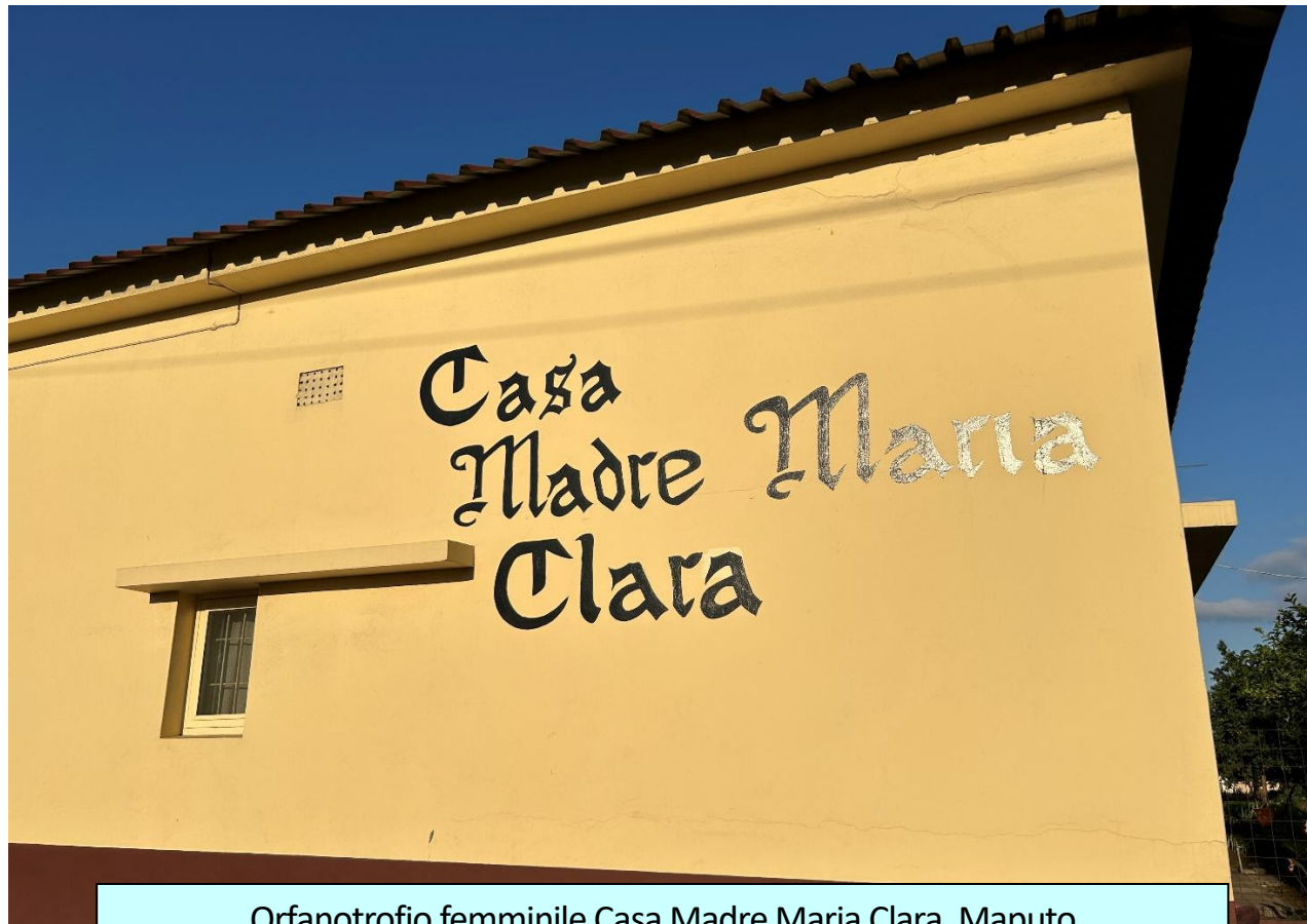
Orfanotrofio femminile Casa Madre Maria Clara, Maputo