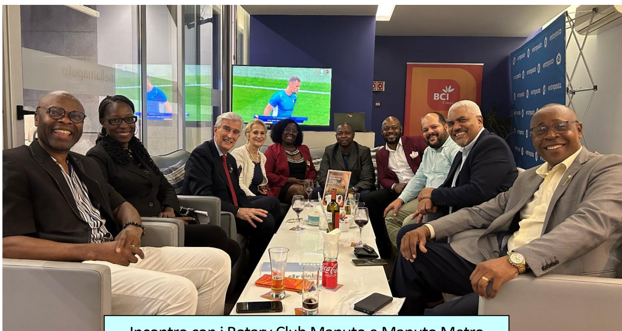
Incontro con i Rotary Club Maputo e Maputo Metro