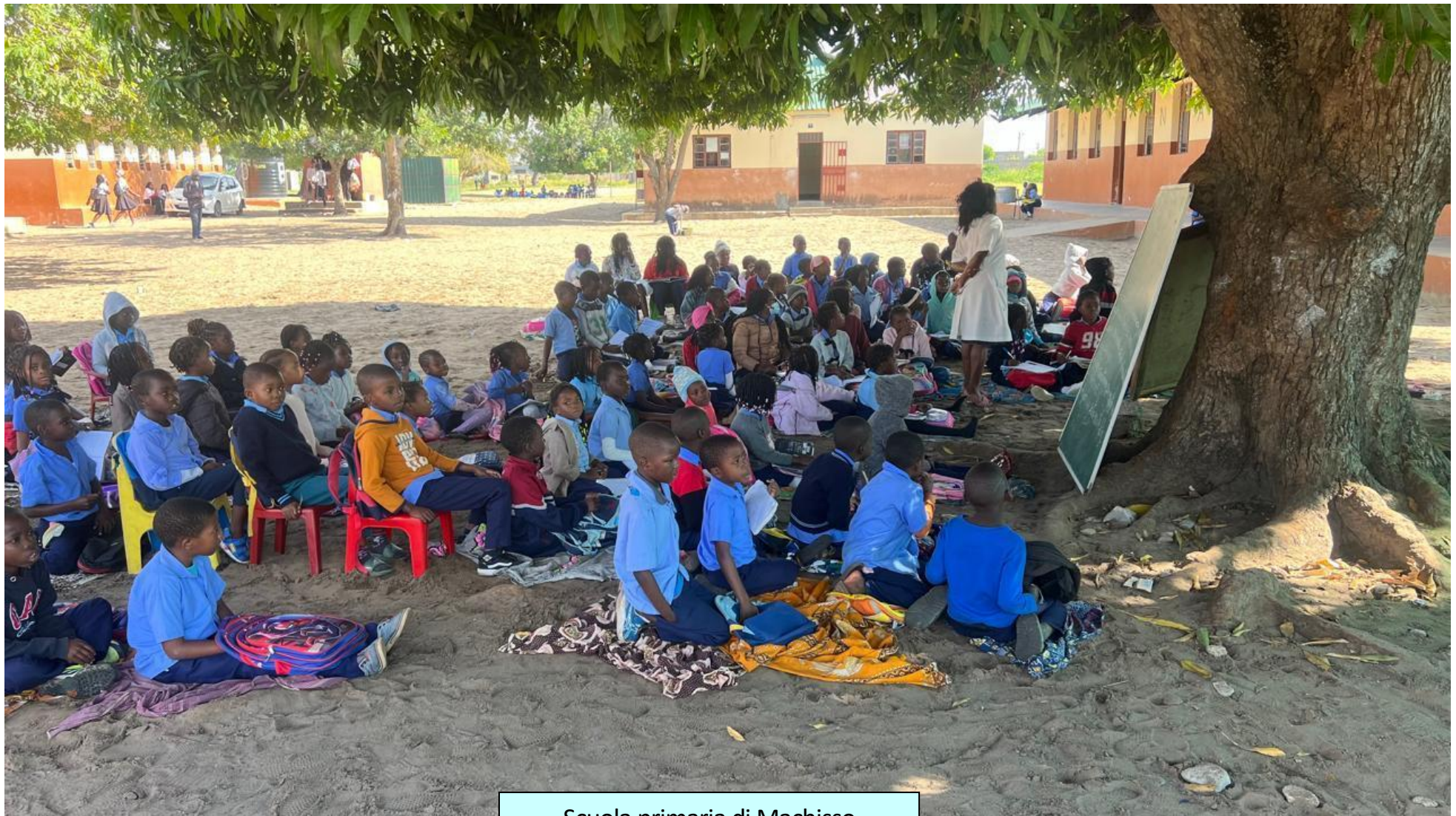
Scuola primaria di Machisso