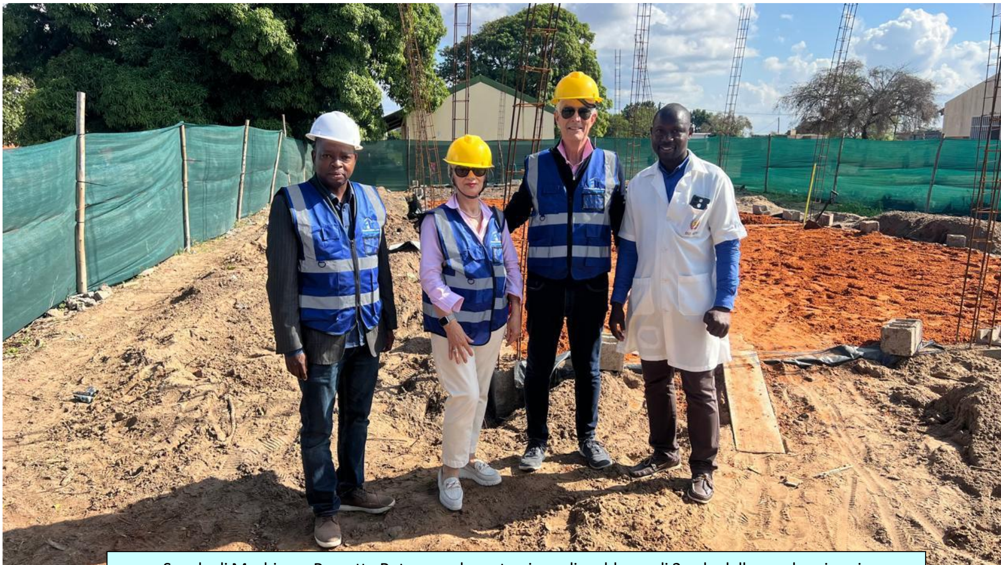
Scuola di Machisso - Progetto Rotary per la costruzione di un blocco di 3 aule della scuola primaria